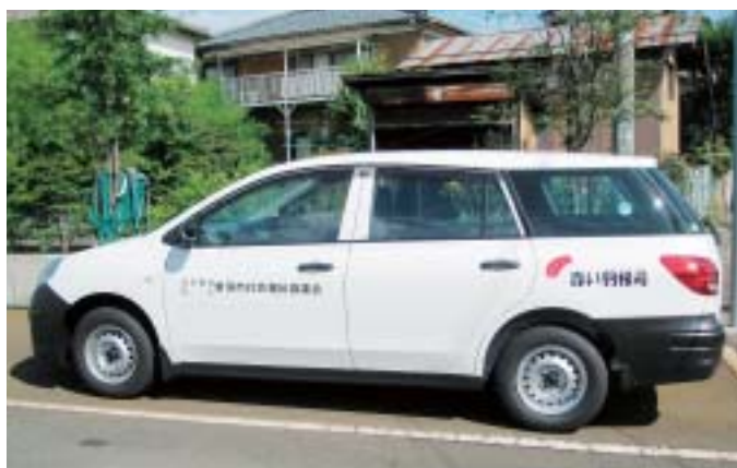
「赤い羽根号」を秋葉区社協に贈っていただきました。