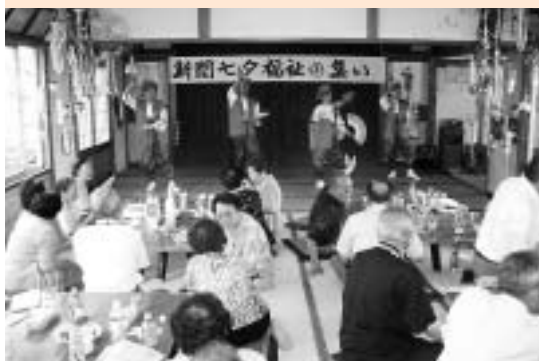
みんなで楽しんだ七夕福祉の集い (7月6日 新関地区社協主催)

秋葉区社協は、地区社協を住民相互の助け合い活動の基礎単位と考え、その育成をすすめています。