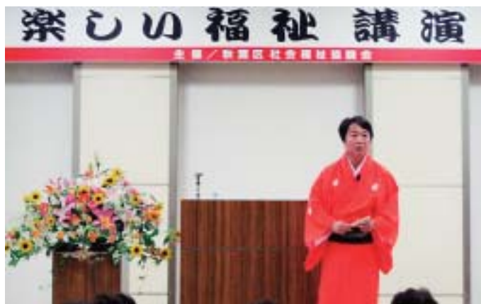
福祉講演会(7月27日 新津健康センター) 大勢のみなさんから おいでいただきました。