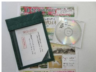
毎月2回、区だよりの音声版(CD)を作成し、お届けしています。

「音声訳ってなに？」という興味のある方、自分の時間を活動に使いたい方、お気軽に秋葉区ボランティア・市民活動センターへお問合せください♪