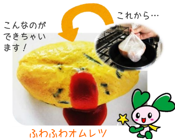
ふわふわオムレツ